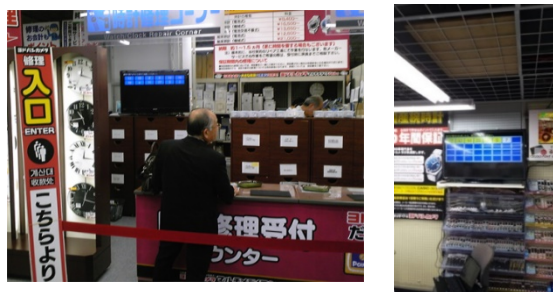
大手家電時計売り場様